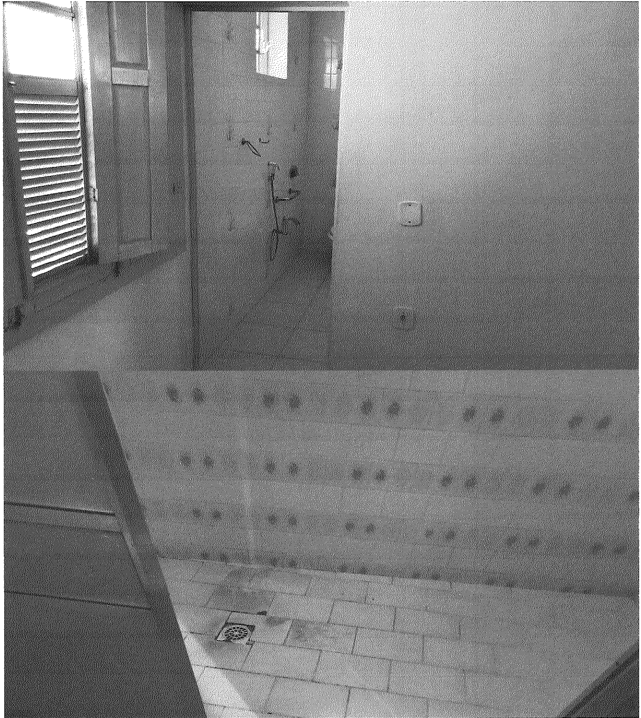
ETAPA: ANTERIOR À EXECUÇÃO DA OBRA