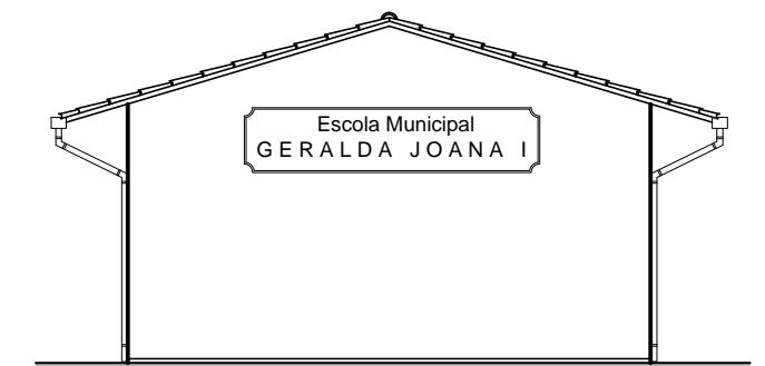
Fachada 02 ESCALA 1/100