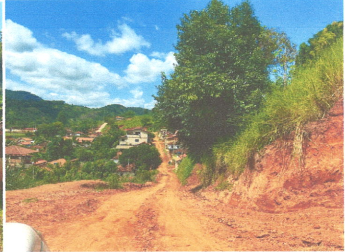
Rua José Horácio