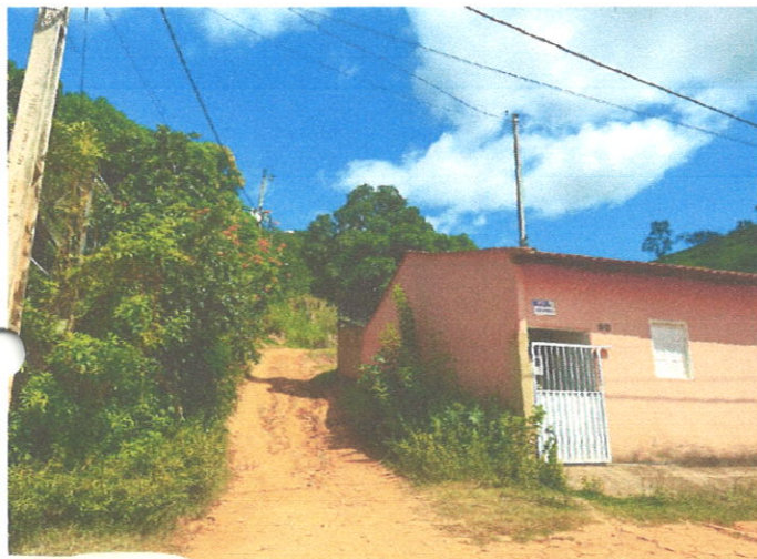
Rua Aroldo Vieira Campos

ENDEREÇO: RUA MANOEL ESTEVÃO LOPES, RUA JOSE HORACIO, RUA JOÃO RUELA, RUA AROLDI VIEIRA CAMPOS, RUA MANOEL DE SOUZA LIMA, RUA ANTONIO FRANCISCO TAVARES – ROSEIRAL - MUNICÍPIO DE MUTUM/MG.