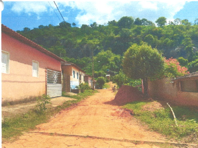
Rua José Horácio