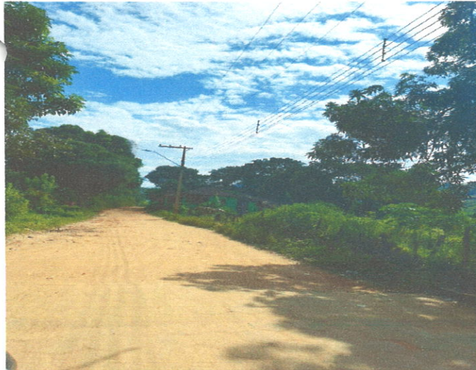
Rua Antonio Francisco Tavares