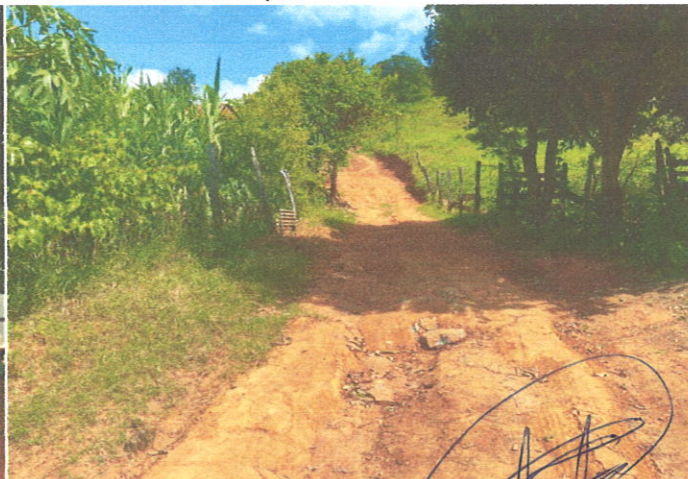
Rua João Ruela