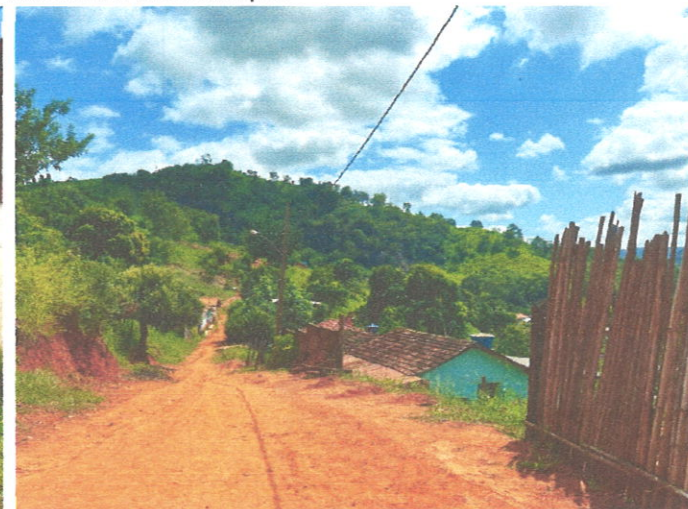
Rua Manoel Estevão Lopes