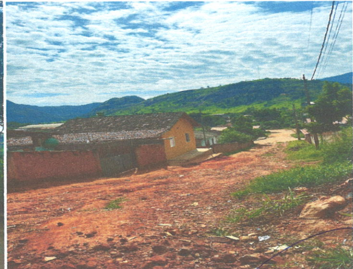
Rua Manoel de Souza Lima