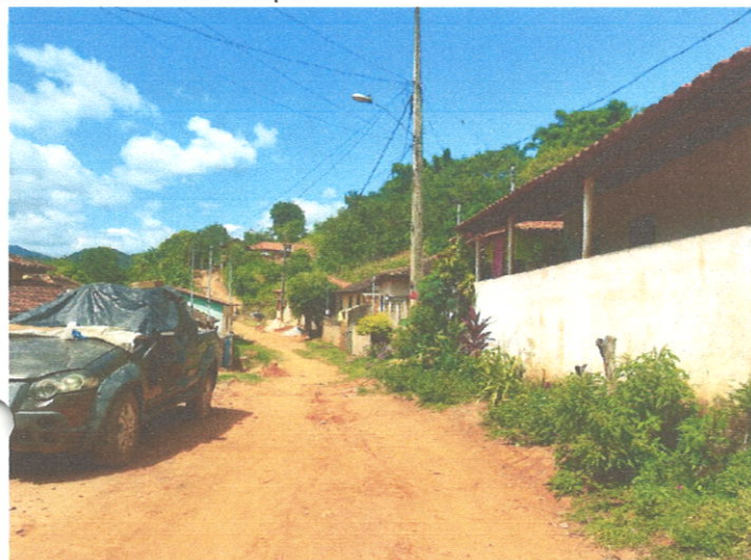
Rua Manoel Estevão Lopes