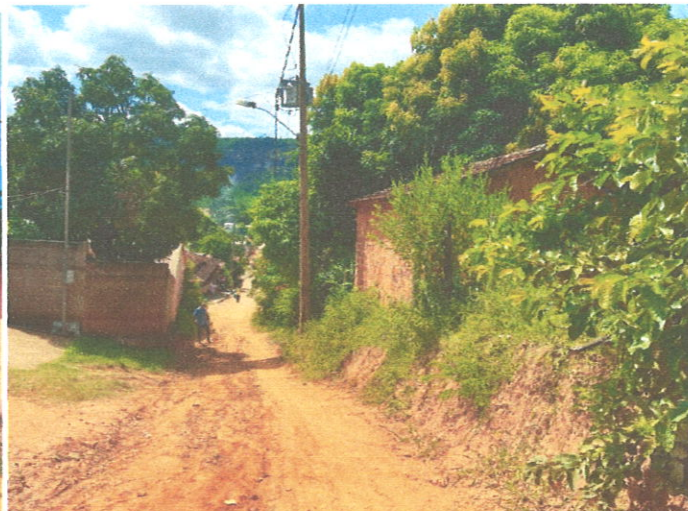
Rua Aroldo Vieira Campos