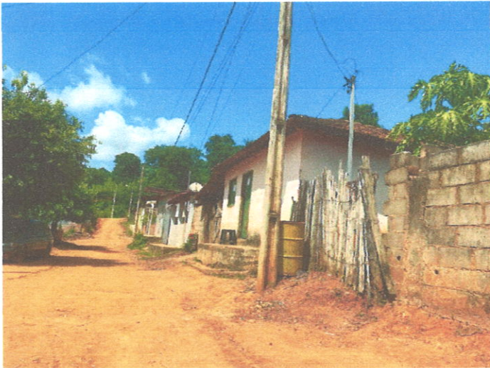
Rua José Horácio