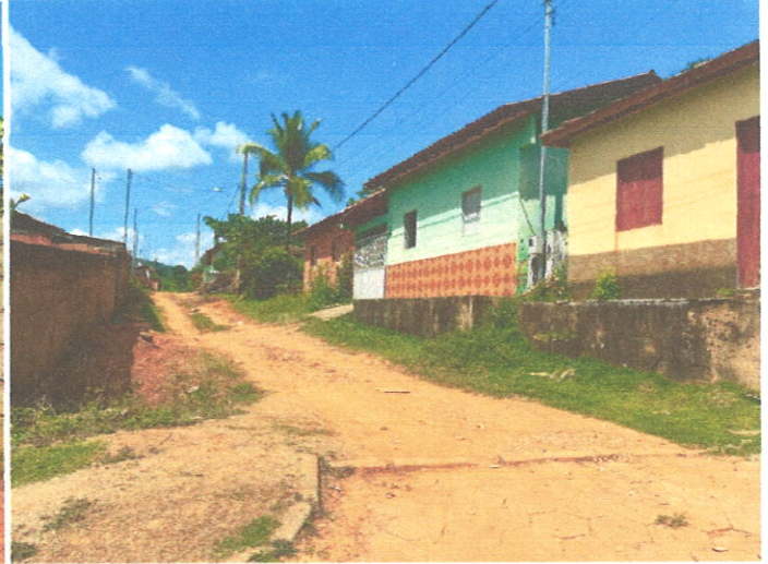
Rua José Horácio