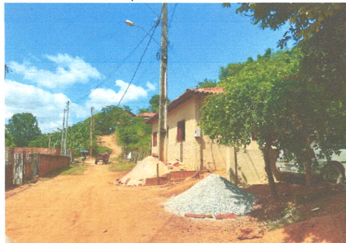
Rua Manoel Estevão Lopes