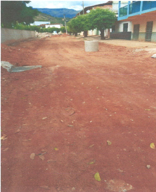
FOTO: RUA AGUSTAVO TEODORO

ENDEREÇO: RUA IRACEMA DE SOUZA, RUA AGUSTAVO TEODORO, RUA CORONEL JOSE FRANCISCO TAVARES, PRAÇA ARLINDO BATISTA, ROSEIRAL, MUTUM – MG